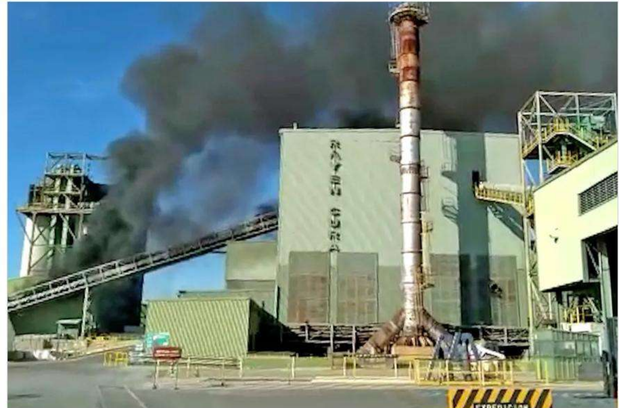
Incendio en la firma Verallia, en la comuna de Guaymallén, en Mendoza. Es una de las principales fábricas de envases de vidrio en el país.

Faltan de 20% a 30% de las botellas de vidrio que la industria vitivinícola necesita. Qué reclaman al Gobierno, cómo impacta en el consumo y qué estrategias implementan las bodegas para sortear esta crisis.