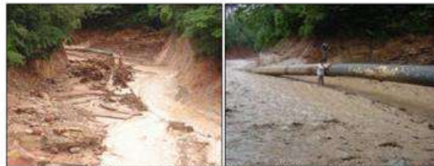
Vistas del ducto de 28" de diámetro (derecha), luego del aluvión.

Afectó en forma significativa las exportaciones del país.