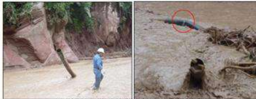
Vistas del ducto de 8" de diámetro, luego del aluvión.